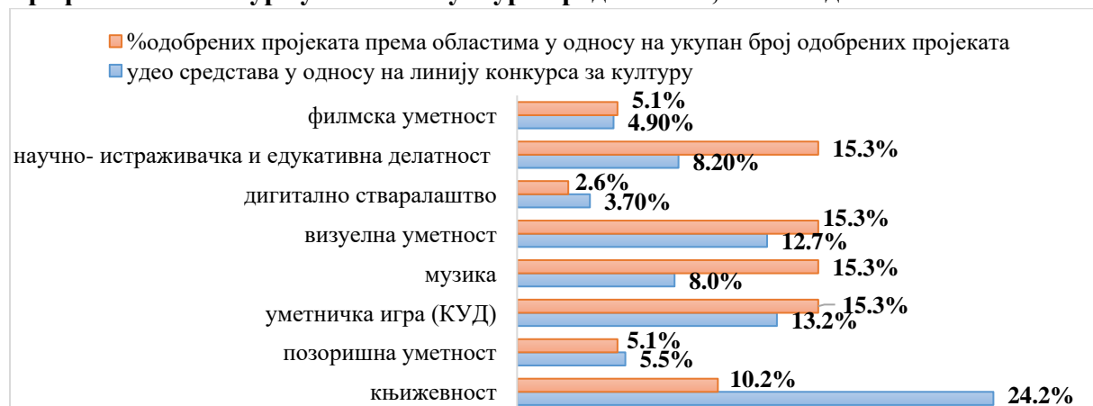
Графикон 1: Конкурс у области културе Града Чачка, 2022. година

Град Чачак не уплаћује порезе и доприносе самосталним уметницима у култури , што је прописано чланом 70. Закона о култури.